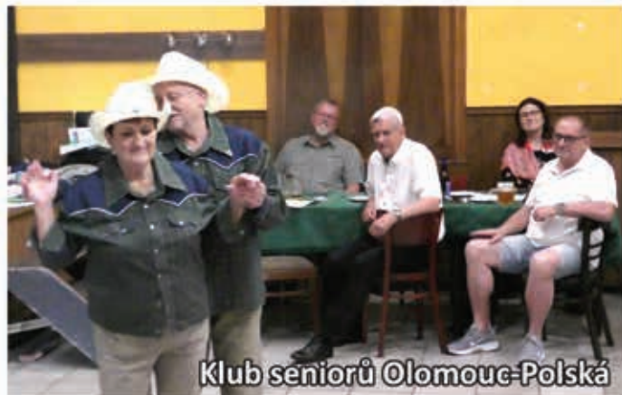
Klub seniorů Olomouc-Polská