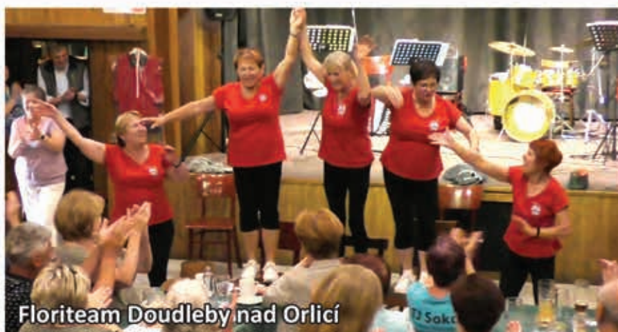
Floriteam Douhleby nad Orlicí