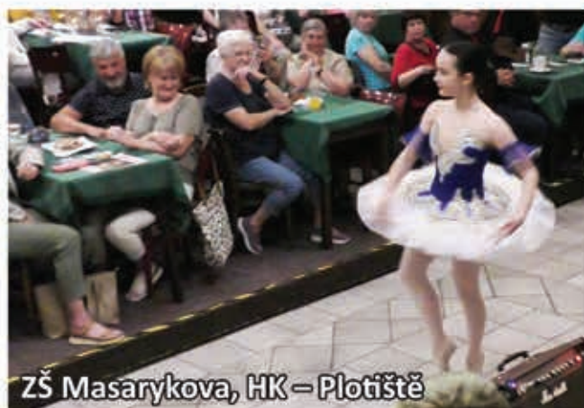
ZŠ Masarykova, HK – Plotiště