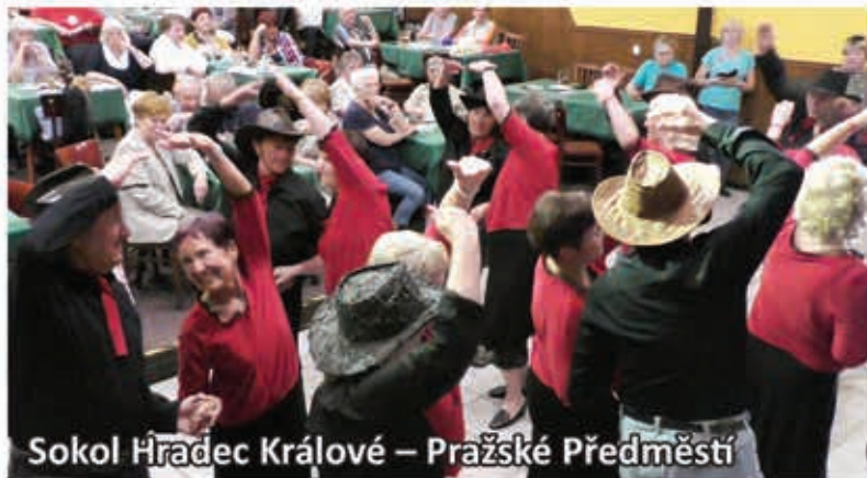
Sokol Hradec Králové – Pražské Předměstí