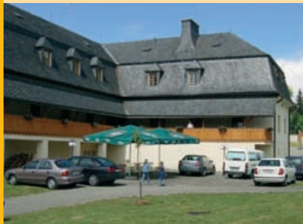
Restauracja - Hotel Fojtství

RESTAURACJA U MACKŮ Dvorského 32, Olomouc – Svatý Kopeček Tel: +420 585 385 344 Szeroki wybór dań tradycyjnej kuchni czeskiej oraz najróżniejszych dań specjalnych WT – SO 10.00 – 22.00, NIE 9.00 – 22.00