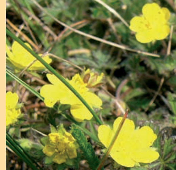
Park Naturalny doliny Bystrice