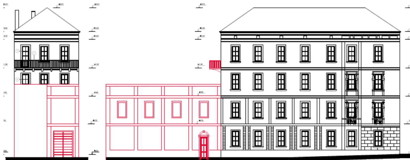
studie záměru - uliční pohledy

Úpravy průčelí do Křivé ulice po dostavbě: