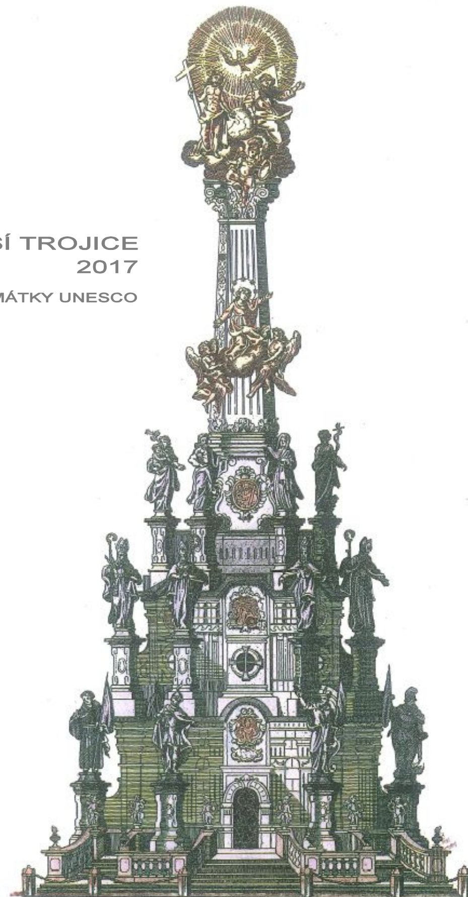
Abbildung der heiligen Dreyfältigkeit Säule auf den Oberring in Olmütz. Olmütz bey Martin Faltrus

ZPRACOVÁNO ZA POMOCI DOTACE Z PROGRAMU MK ČR - PODPORA PRO PAMÁTKY UNESCO