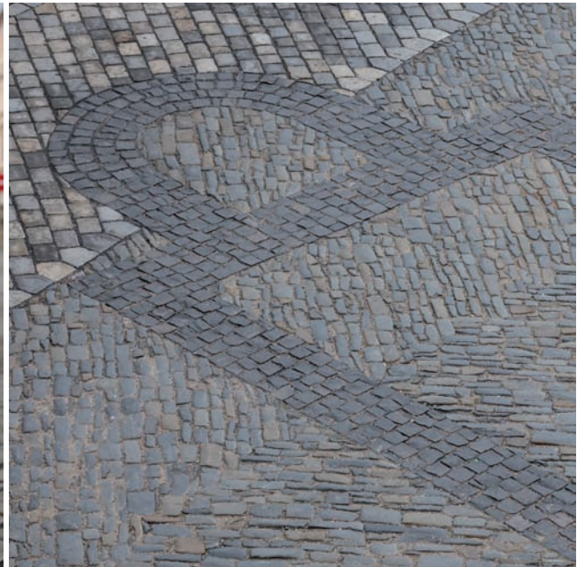
Dolní náměstí – rekonstrukce | Lower Square – renovation