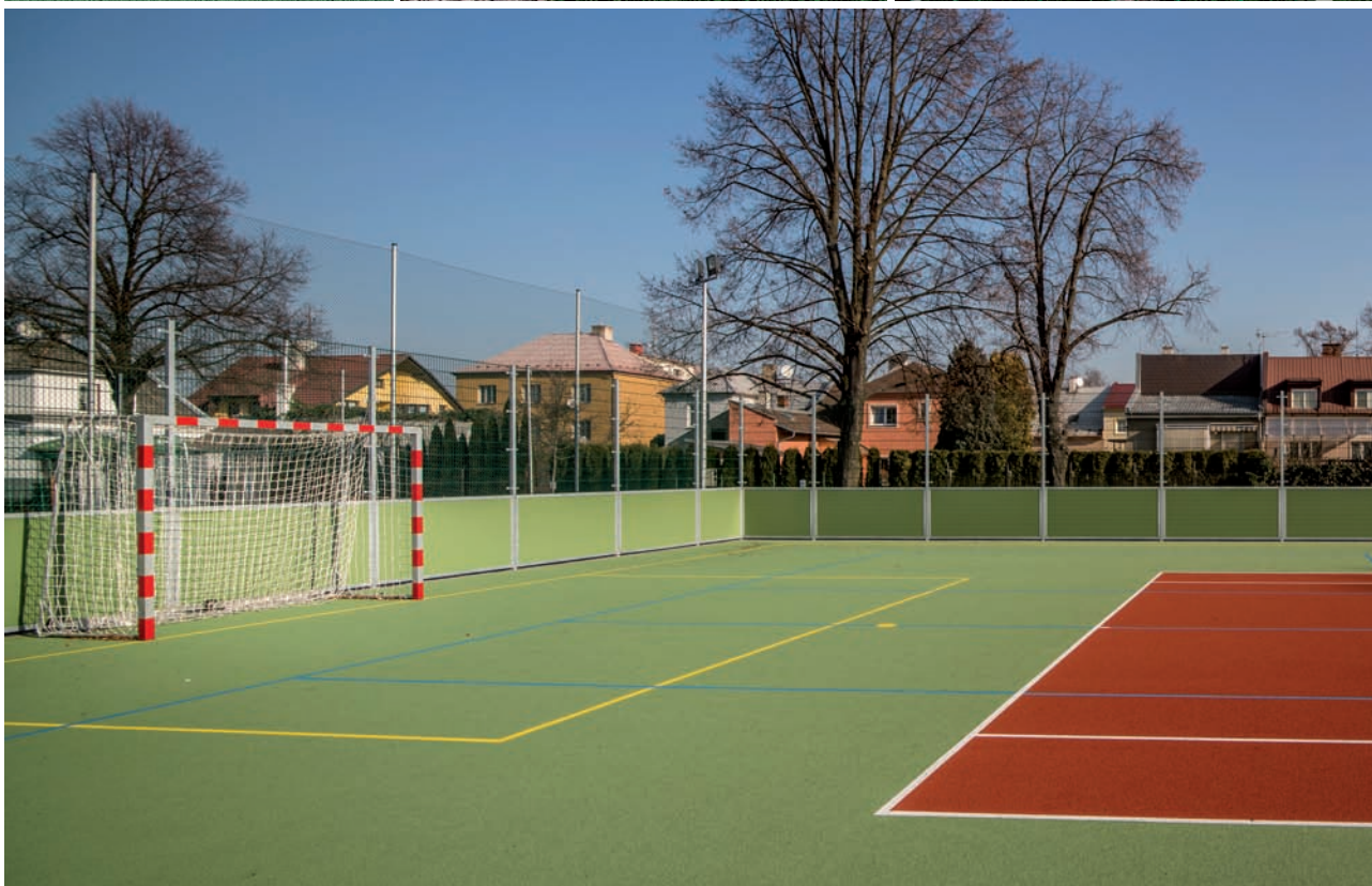
TJ Sokol Nový Svět – vybudování hřiště s umělým travnatým povrchem a osvětlením pro malou kopanou TJ Sokol Nový Svět – building a playground with an artificial grass surface and lighting for five-a-side football