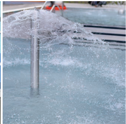
Plavecký stadion – rekonstrukce venkovního areálu | Swimming Pool Stadium – renovation of the outside area