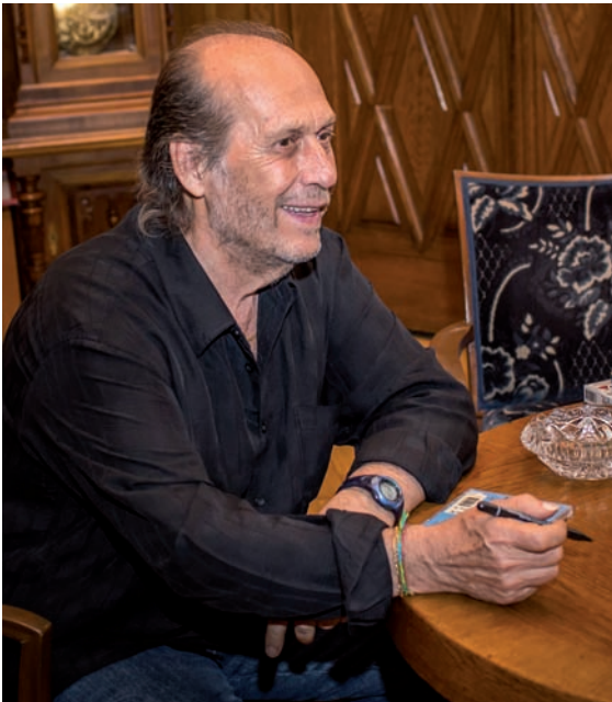
Open-air představení na Horním náměstí Paco De Lucia | Paco De Lucia open-air performance on the Upper Square