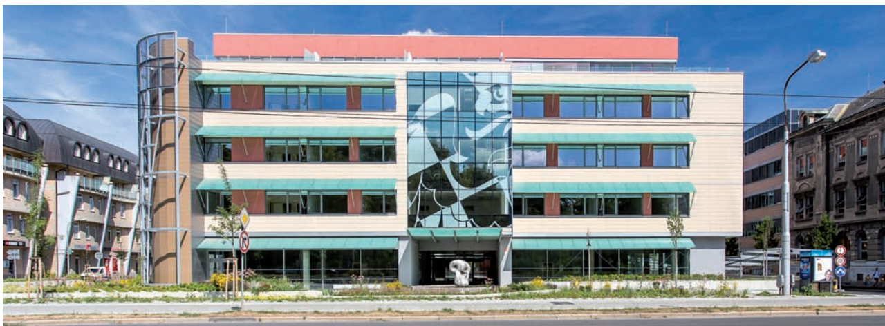
Nová administrativní budova Namiro | Namiro new administrative building

Rekapitulace přehledu zadluženosti statutárního města Olomouce k 31. 12. 2013 dle níže uvedené tabulky.