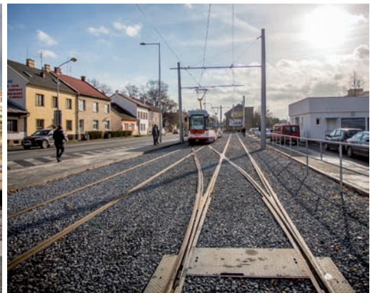
Tramvajová trať Nové Sady | Nové Sady tram line