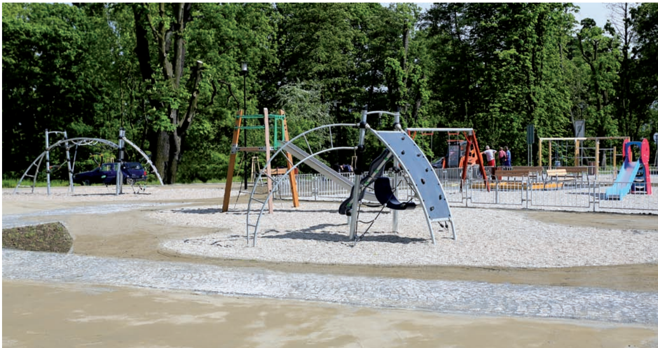
Dětské hřiště v Bezručových sadech | A children's playground at Bezručovy sady