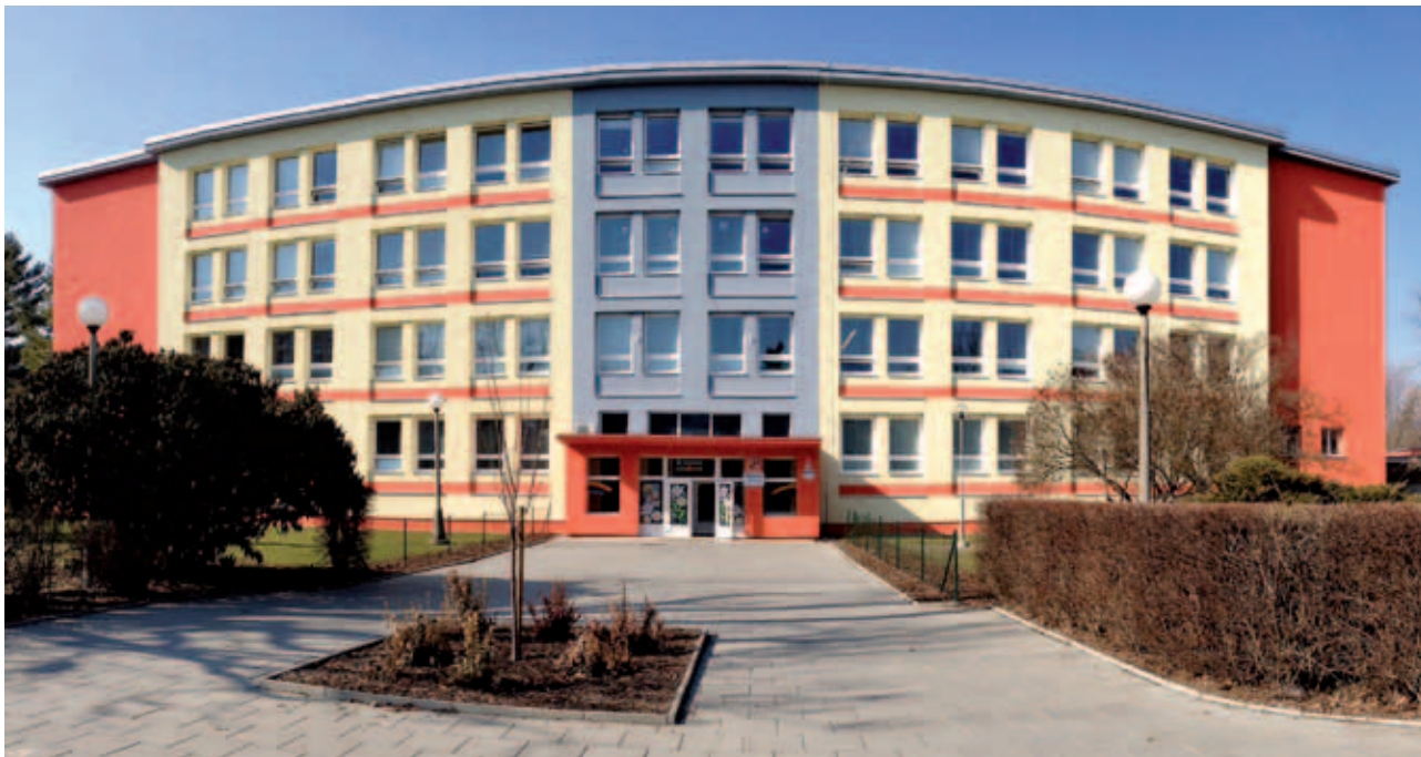
Energetická opatření – ZŠ Zeyerova | Energy conservation measures – Zeyerova basic school