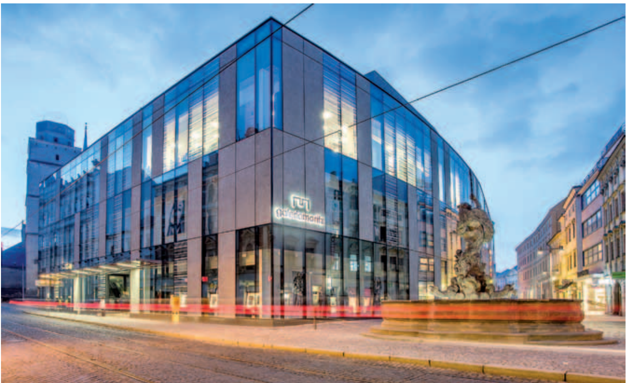
Rekonstrukce Pρίου, ulice 28. října, Úzké a Mořického náměstí | Reconstruction of the Prior department store, 28. října Street, Úzká St. and Moritz Square