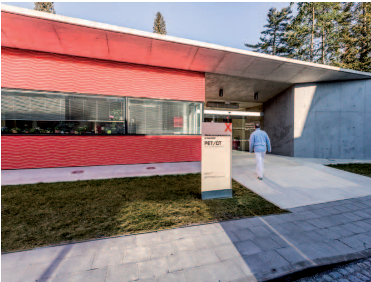
Dokončení výstavby pracoviště PET Kliniky nukleární medicíny v areálu FNO Completion of the PET Nuclear Medicine Clinics at the University Hospital in Olomouc