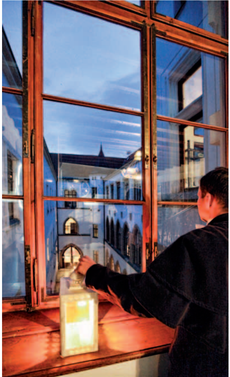
Večerní prohlídky radnice | Evening tours of the Town Hall