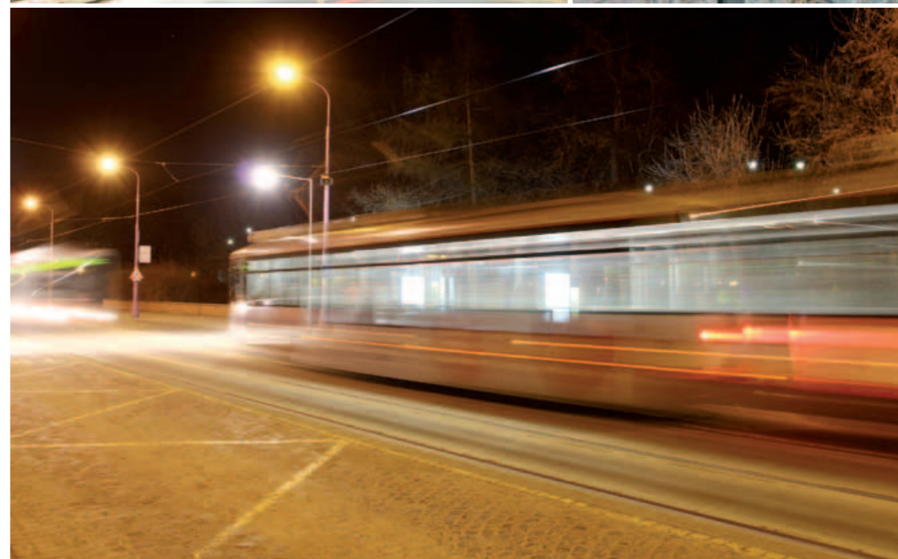
Rekonstrukce ulice Štítného a tramvajové zastávky Výstaviště Flora | Reconstruction of Štítného street and the tram stop Flora Exhibition Ground