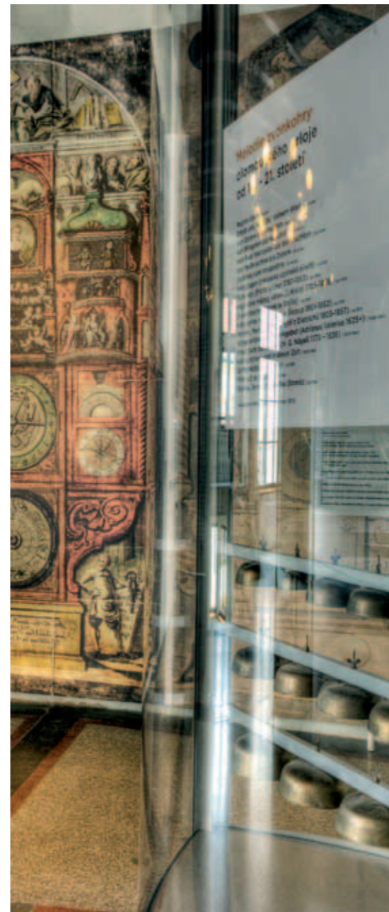
Astronomical Clock Exhibition at the Town Hall

Revision of the debt review of the Statutory City of Olomouc as of 31 st December 2011 in the following chart.