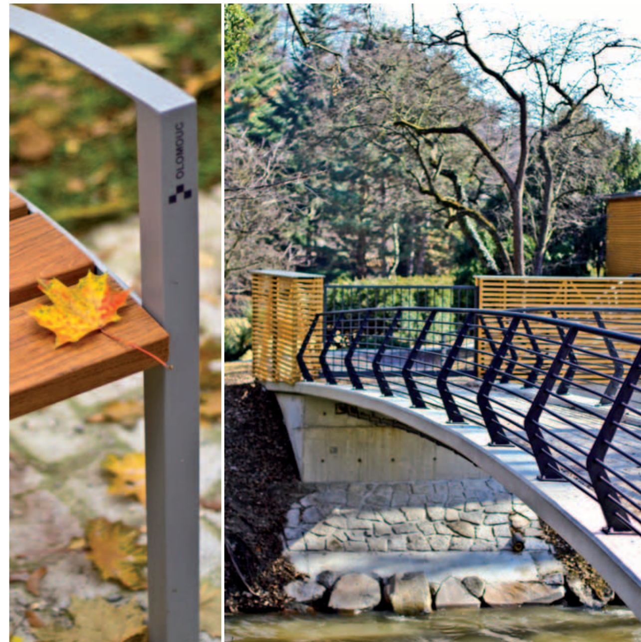
Zrekonstruované Bezručovy sady | Reconstruction of the Bezruč Park