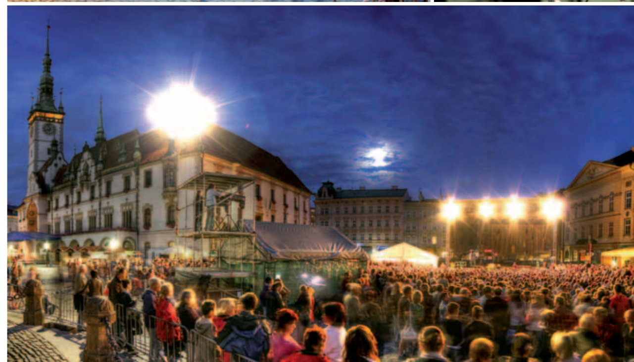
Uvedení opery Prodaná nevěsta na Horním náměstí v rámci Dnů evropského dědictví Presentation of the opera The Bartered Bride at the Upper Square during European Heritage Days