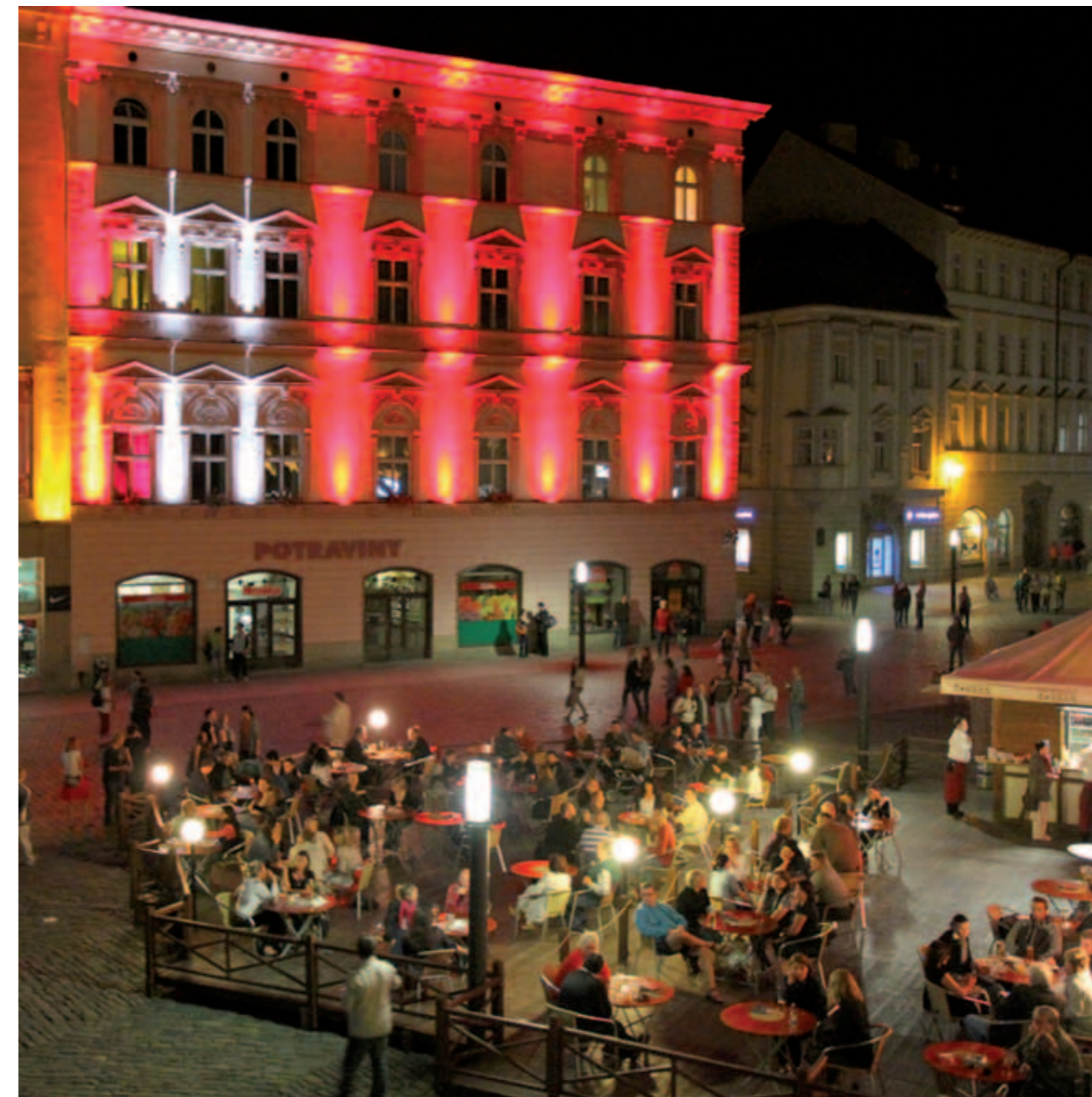
Festival světla a videomappingu „VZÁŘÍ“ | Festival of Light and Video Mapping “VZÁŘÍ”