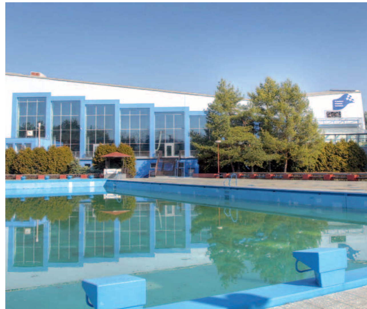
Nové opláštění budovy plaveckého stadionu | New cladding of the Swimming pool building