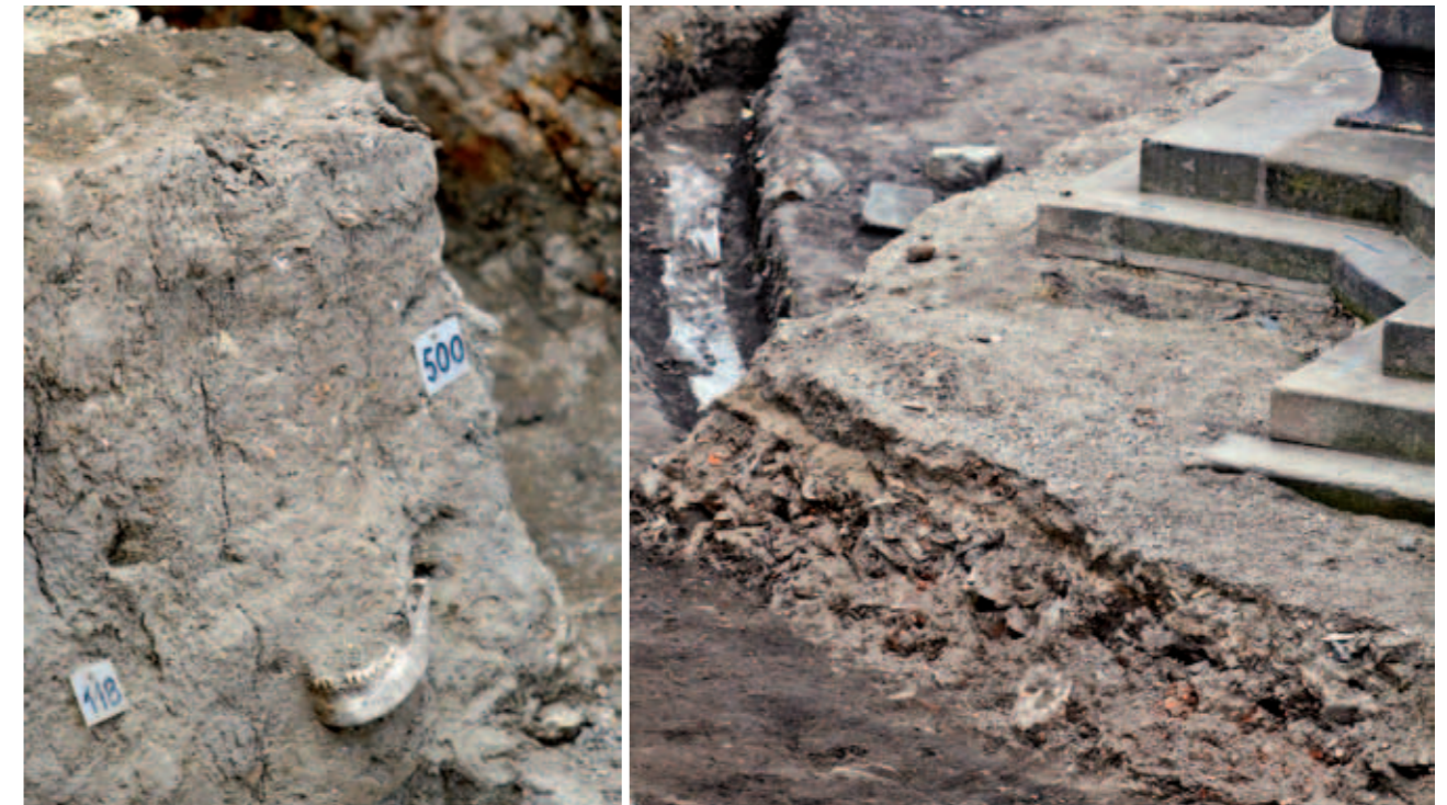
Archeologický průzkum na Dolním náměstí | Archaeological survey on the Lower Square