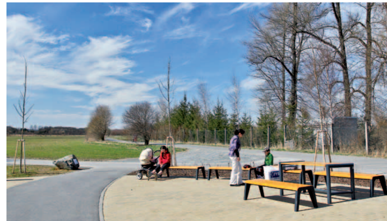
In-line stezka Hejčínské louky | In-line trail Hejčínské louky