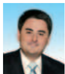
Martin Novotný odbor kancelář primátora | Office of the Mayor odbor koncepce a rozvoje | City Development Office Městská policie Olomouc | Olomouc Municipal Police

Primátor statutárního města Olomouce | Mayor of the Statutory City of Olomouc