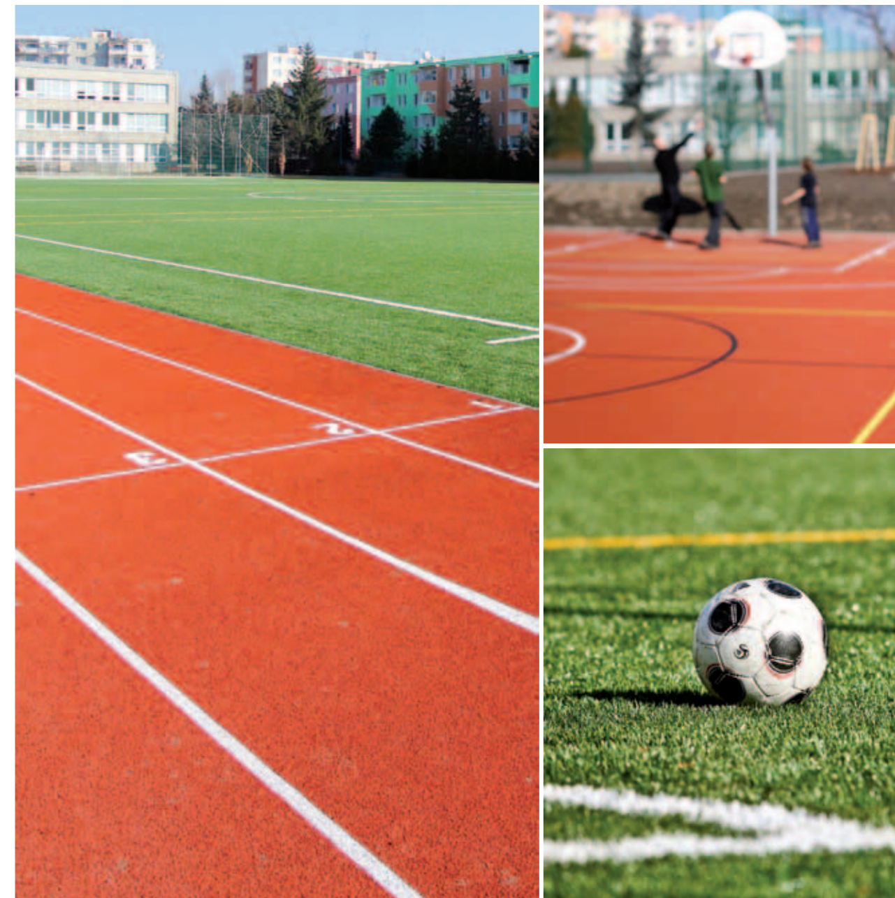
Nové sportoviště při ZŠ Heyrovského | New sports facilities at the Heyrovský Primary School