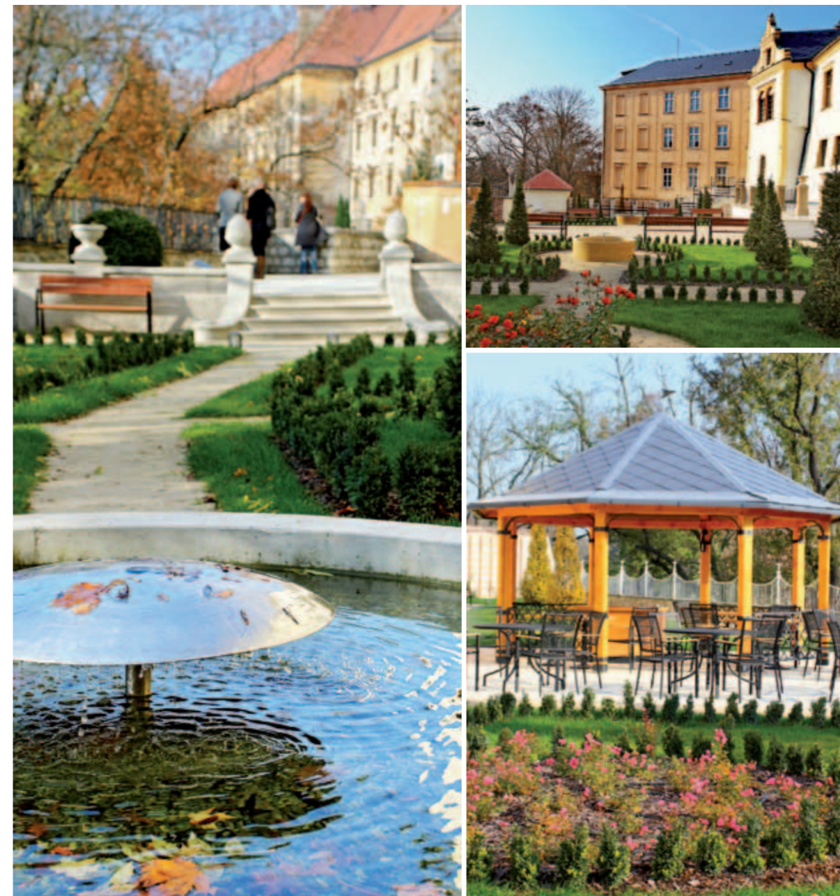
Rekonstrukce zahrad na hradebních parkánech | Reconstruction of gardens on the town walls