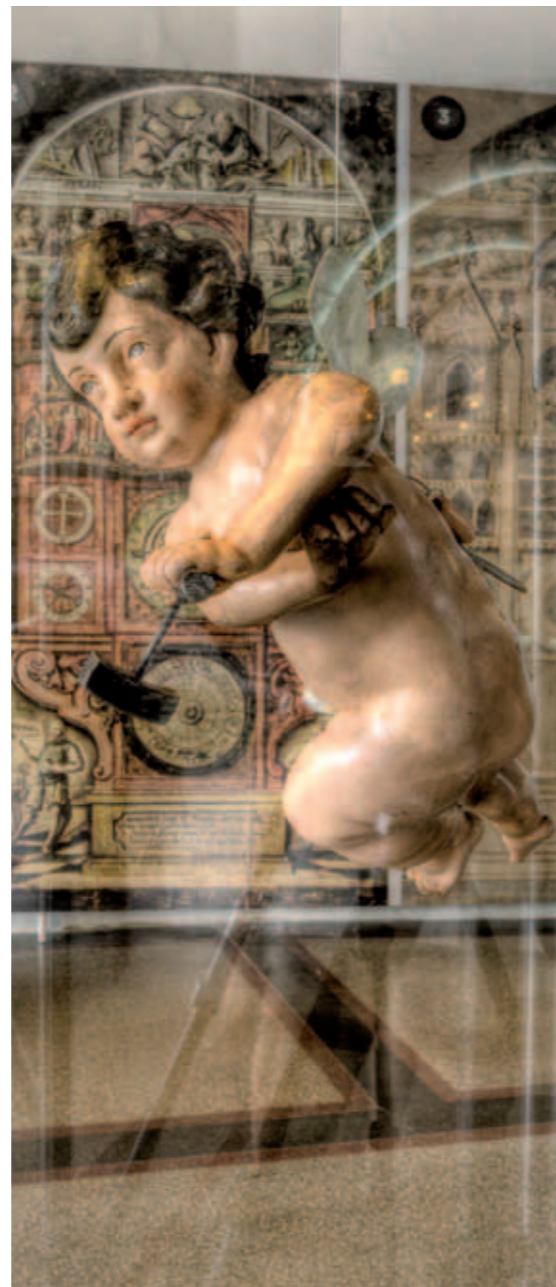
Expozice orloje na olomoucké radnici

Rekapitulace přehledu zadluženosti statutárního města Olomouce k 31. 12. 2011 dle níže uvedené tabulky.