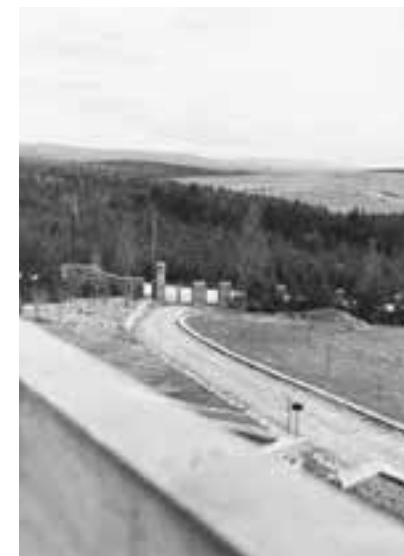
Výhled ze Šmeralovy vily