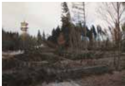
Následky jarní vichřice

doucí, jelikož působí škody okusem a vytloukáním. Bude potřeba založit nové lesní porosty umělou výsadbou nebo počítat s přirozenou obnovou. Rád bych poznamenal k úhynům srnčí zvěře a to 5 ks srnčat a 2 ks srn, že velkou mírou se na něm podíleli volně pobíhající psi. Z toho lze jen konstatovat, že spousta majitelů nedbá na etiku a právo volně žijících živočichů, kteří mají svůj prostor k žití. Nebudu připomínat, že existují i nějaké zákony na ochranu prostředí (zákon o myslivosti, o lesích, o ochraně krajiny a životního prostředí).