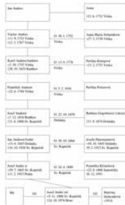
Mužská linie rodu Ander (= Anderer = Andres)