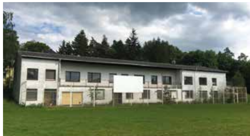
Budova Kříčkova 4

V souvislosti se snahou KMČ Svatý Kopeček vybudovat v budově na Kříčkově ulici č. 4 multifunkční sál pro pořádání kulturních a sportovních akcí nejen pro obyvatele Svatého Kopečka musíme konstatovat, že ani v roce 2018 Statutární město Olomouc nenalezlo finanční krytí pro realizaci tohoto projektu, který je důležitý pro další společenský, kulturní a spolkový rozvoj naší městské části. Je nutno