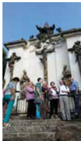
Kalvárie – M. Třebová