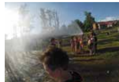
Rodinné hodové odpoledne