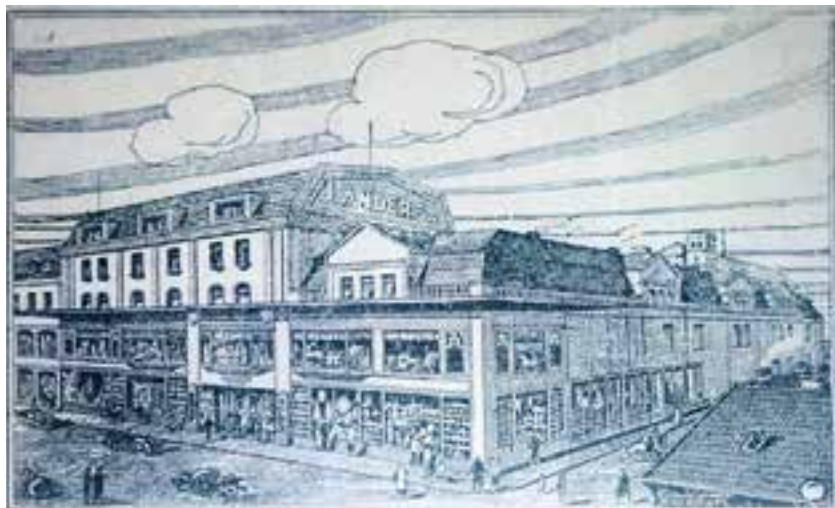
Reklamní leták olomouckého obchodního domu Ander a syn z roku 1929