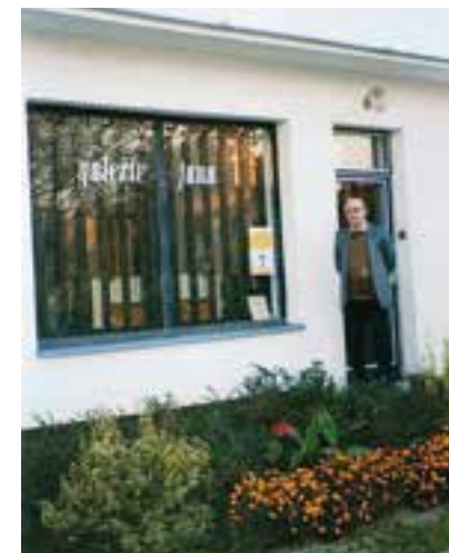
Vzpomínka na Galerii Jana

Doposud i po odstoupení z výboru Matice se podílí na propagaci oblíbeného poutního místa úspěšnou činností průvodcovskou v bazilice. Pravidelně přispívá do svatokopecké ročenky vzpomínkovými medailony významných svatokopeckých občanů