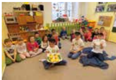
Škola – Zdravá svačinka

trávit čas venku na školním sportovišti, kde mají k dispozici stolní tenis, posezení a hřiště.