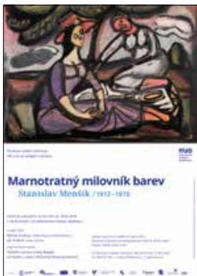
Pozvánka na výstavu St. Menšíka