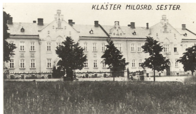
Původní podoba školní budovy, tj. kláštera sester františkánek. Nyní Základní škola a Mateřská škola Olomouc, Dvorského 33, příspěvková organizace.

28. 6. 2021 / Slavnostní zakončení školního roku