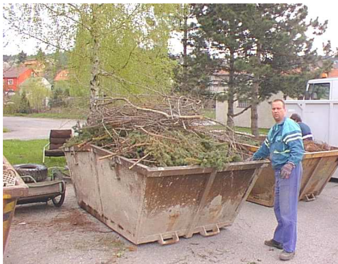
Kontejner na bioodpad je okamžitě plný a odvoz vážne....

Anketní lístky byly předány odboru životního prostředí Magistrátu, kde vše bude vyhodnoceno a s Komisí městské části bude situace dále upřesňována.