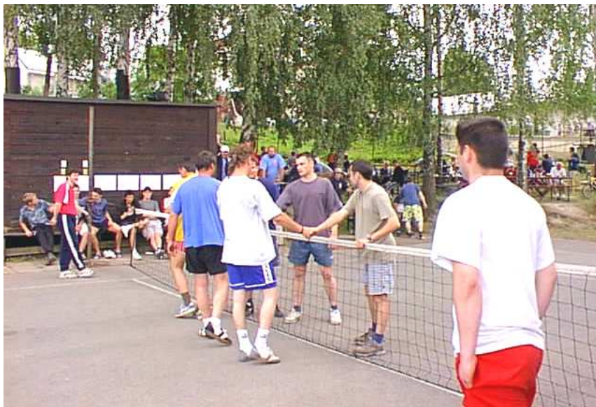
Skončilo finále, vítězí opět „Moráci“.....

Družstva z řad místních seskupení, ale i z Opavy, Olomouce a Radíkova u Hranic svedla napínavé boje. Ani tentokrát se nenašel přemožitel družstva „Moráků“ a tak nic nového pod sluncem.