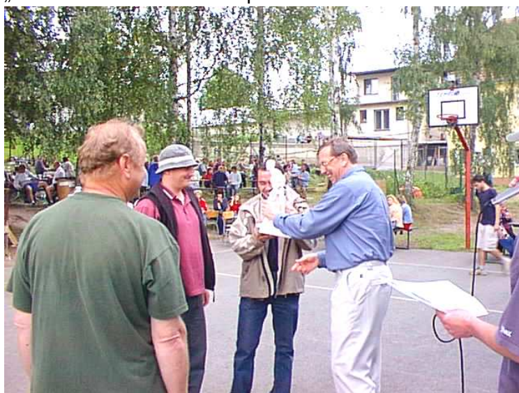
Primátor Ing.Martin Tesařík předává cenu vítěznému družstvu

Pozvání na předání cen od KMČ přijal i primátor města Olomouce pan Ing.Martin Tesařík. Právě z jeho rukou za asistence jeho manželky přejímala družstva, která se umístila na předních místech ceny. Vítěznému družstvu předal primátor osobní cenu. Bezprostředně působila setkání občanů s primátorem ať už se diskutovalo na jakékoliv téma. Přišla řeč i na nevyhovující stav sociálního zařízení místního sboru hasičů, které chtěl primátor shlédnout a přislíbil řešení. Kácení máje bylo svěřeno vítěznému družstvu. I tento výkon byl oceněn potleskem přítomných.