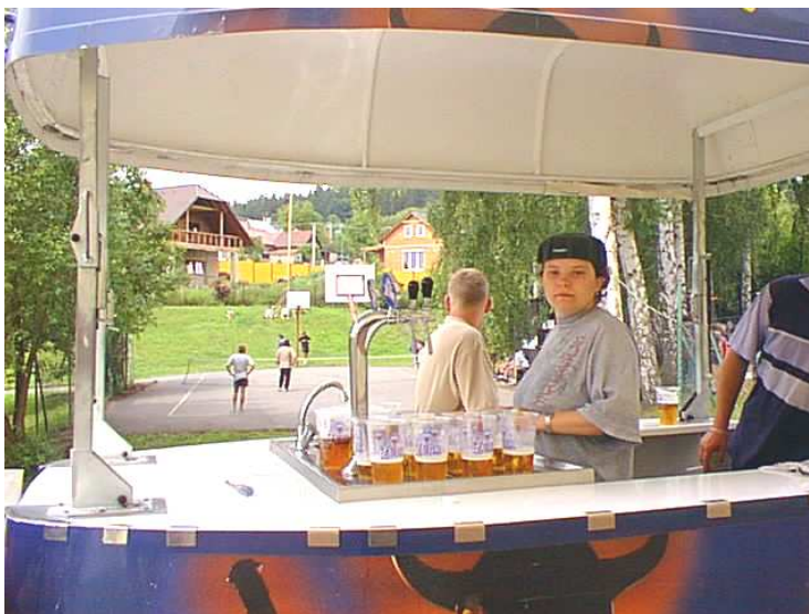
Pojízdný výčep i střídající se směny