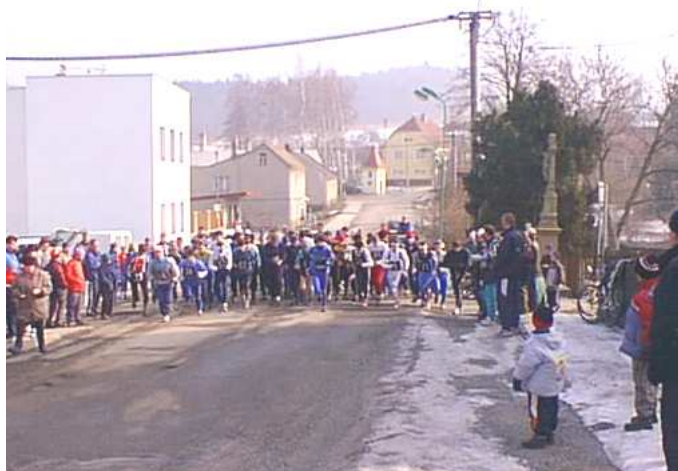
Předstartovní hemžení při 1.ročníku Radíkovské patnáctky v roce 2003