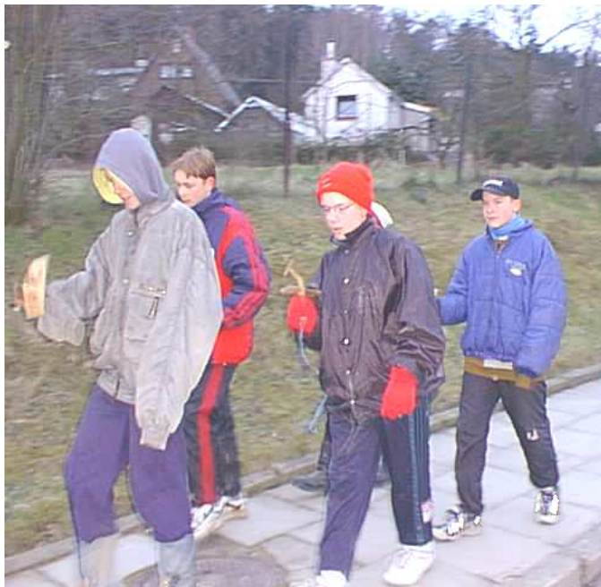
Klapání malých chlapců před Velikonocemi je předzvěstí velikonočních svátků...