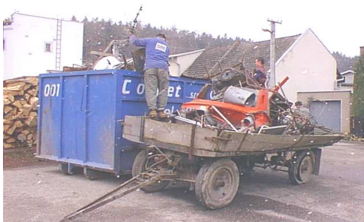
Bez namáhavé fyzické práce se sběr šrotu neobejde....

din. Svůj odpad musíte dovést sami na točnu autobusů MHD. Přítomni budou pracovníci TSMO, kteří budou odpad třídit a dohlížet na naplňování kontejnerů. Kontejnerů bude dostatek a tak neváhejte a včas se rozhodněte, které nepotřebné věci odložíte. Další možnost se naskytne opět až na přelomu září a října. Poprvé bude také přistaven kontejner na odložení organického odpadu (plevel, listí, větve ze stromů apod.) . Jedná se o rozšíření služeb, které navazuje na