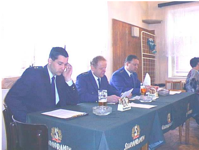
Předsednictvo valné hromady SDH Olomouc - Radíkov

Úspěšná kulturní a společenská činnost, práce pro městskou část Radíkov v podobě pravidelného zajišťování sběru železného šrotu, za to vše patří místním hasičům poděkování. Také kasa nezeje prázdnotou a i to svědčí o dobré práci vedení SDH včetně zásahové jednotky.