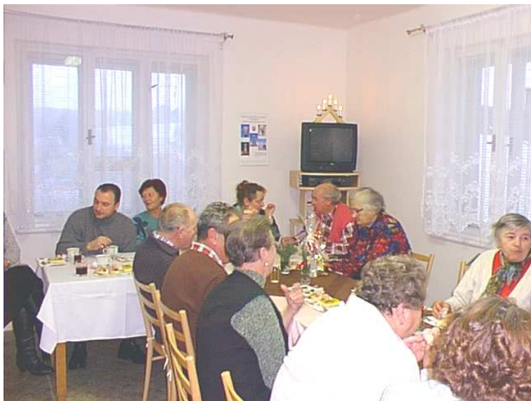
Vánoce 2001 v Klubu důchodců v Olomouci-Radíkově

červen 25.6. turistická vycházka Sv.Kopeček, Kartouzka, Radíkov –posezení u táboráku v Radíkově s občerstvením