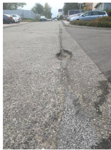
Foto č. 3 oprava silnice Profesora Fuky