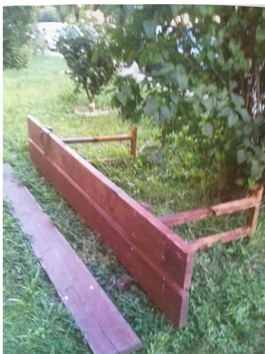
Foto č. 4 Lavička na Hraniční