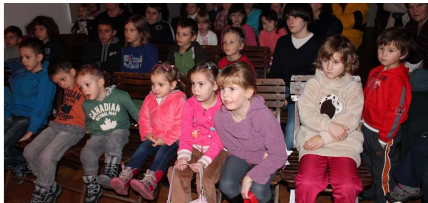
Děti s napětím sledovaly děj, který se odehrával na jevišti.

Pimprlata na nitích předstupují ve chválkovickém loutkovém divadle před přísné dětské publikum už téměř devadesát let. Dětem rozdávají pravidelně radost od roku 1924, kdy Chválkovičtí postavili sokolovnu.