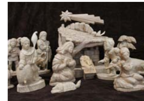
Výstavě dominoval velký vyřezávaný betlém.