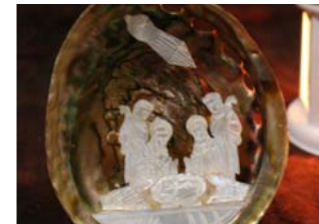
Unikátním kouskem byl betlém z Jeruzaléma.