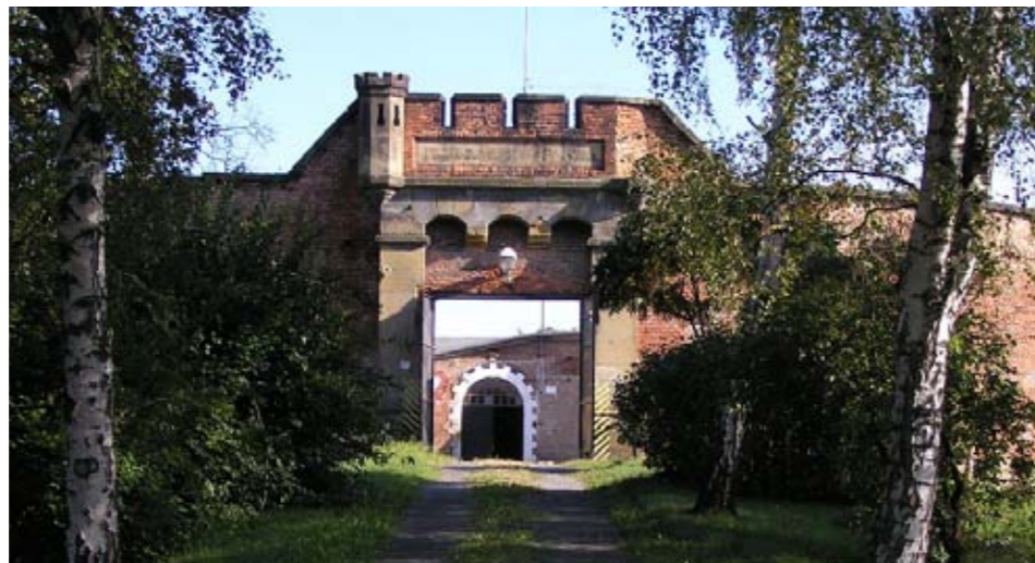
Fort ve Chválkovicích je ve velmi dobrém stavu.

Unikátní památka, vojenská pevnost ve Chválkovicích, je na prodej. Armáda se jí snaží od září prodat, zatím marně.