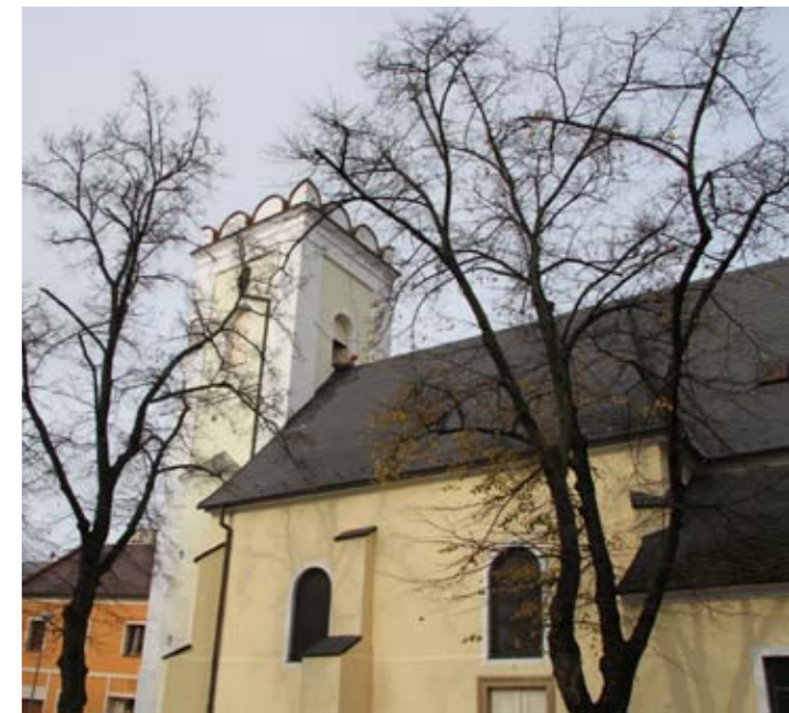
Kostel svaté Barbory s novým nátěrem prohlédl. Oprava stála 247 tisíc korun.

Jako nový vyhlíží teď kostel svaté Barbory s kusou věží na Selském náměstí v Olomouci - Chválkovicích. Dočkal se letos nového nátěru.