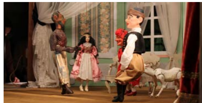
Ke čtyřicítce původních loutek letos přibýlo pět nových. Tři princezny, princ a koza.