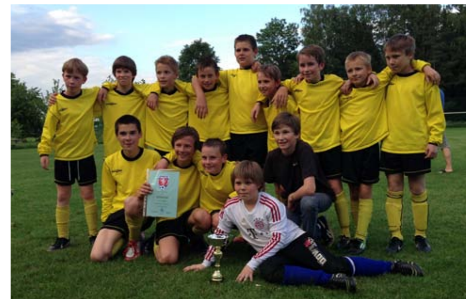
(stev) Mladší žáci SK Chvátkovice.