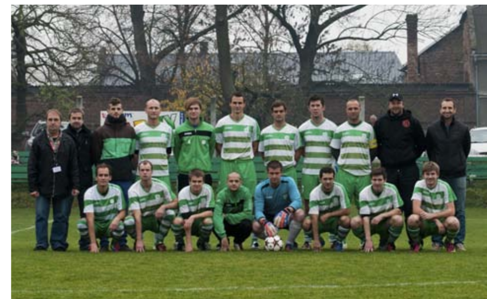
Muži SK Chvátkovice.