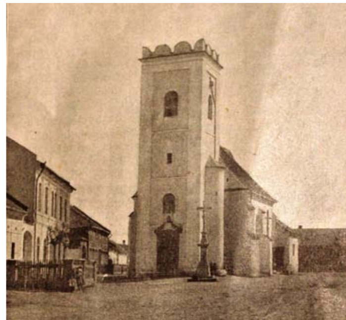
Takto vypadal kostel svaté Barbory před více než sto lety. Reprofoto