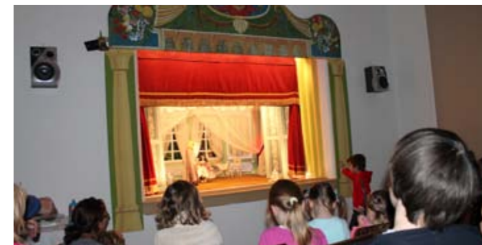
Loutkové divadlo má i v dnešní počítačové a televizní době své kouzlo.