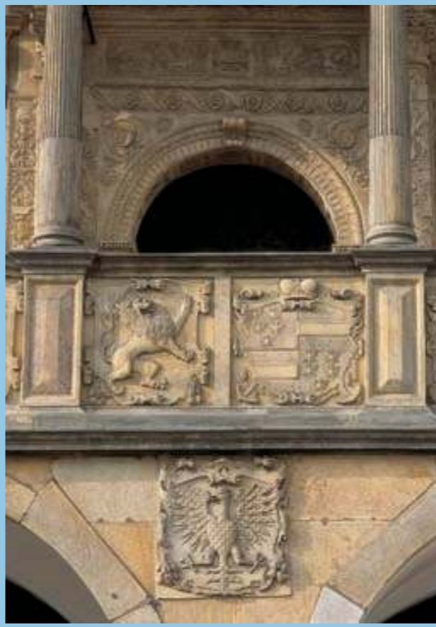
Портал в стиле ренессанс зала совета с периода около 1530 года, согласно вторичному летоисчислению на табличке посередине планки паркета разобранной и снова построенной во второй половине 16 века.

Текст и рисунки: Марек Перутка