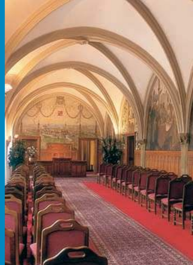
Поздний готический зал на втором этаже северного крыла ратуши, называемый ранее Публикационным. Сначала он был местом общественных собраний и приема почестей от подданных деревень, сегодня служит в качестве обрядного зала.

связи с новыми порядками, которые вводил в королевстве Владислав Ягеллонский. Более приветливое лицо ратуша имела с северной стороны, где именно в это время при поздней готической реконструкции по соседству с ратушной башней возник монументальный каменный эркер курантов, законченный ломаной аркой. Первое конкретное упоминание об оломоуцких курантах можно найти в письменных источниках гораздо позже, в гуманистическом сочинении Штепана Таурина 1519 года. На противоположной стороне восточного ратушного крыла внимание привлекает молельня св. Иеронима на втором этаже, законченная в 1488 году и освященная три года спустя. Сетчатый свод ее нефа лежит на несимметрично расположенных опорах, а алтарь высунут из тела строения ратуши в виде трехстороннего эркера, завершенного наверху ранним закругленным сводом, первым такого типа на север от Дуная. Снаружи вес эркера лежит на фигуральной консоли – мужской груди, интерпретированной как изображение автора строения. Единственной частью ратуши, которой очевидно не коснулись поздние готические реконструкции, оставался к концу 15 века ее восточный фасад. Первыми подтвержденные в летописях изменения его внешнего вида были проведены только в 1529 году, когда