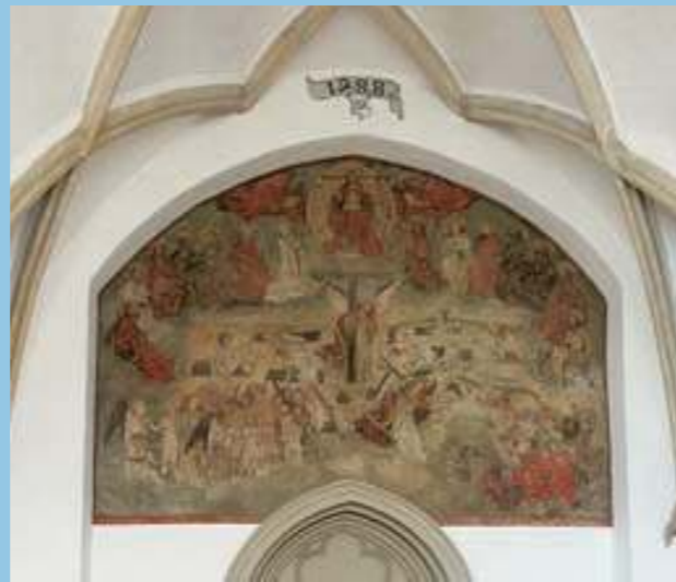
Стенная роспись с изображением Страшного суда над входом в часовню св. Еронима, находящуюся в ратуше (1488)