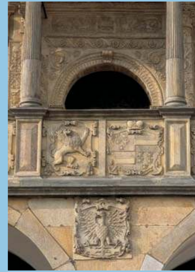
Renesanční portál radní síně z doby kolem roku 1530, podle druhotného letopočtu na štítku uprostřed vlysu rozebraný a nově sestavený ještě v druhé polovině 16. století.

Text a kresby: Marek Perůtka Foto: Milena Valušková, archiv MMO