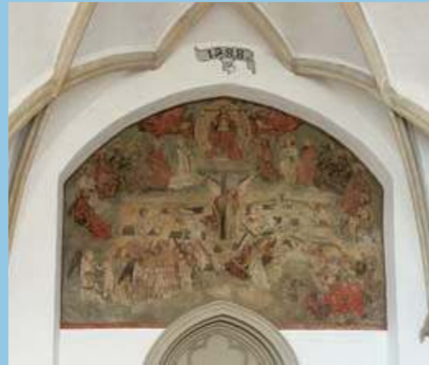
Nástěnná malba s tématem Posledního soudu nad vchodem do radniční kaple sv. Jeronýma, 1488.

ojednitého díla. Následující rok 1899 znamenal počátek úvah o celkovém restaurování budovy, které počítaly s okázalou přestavbou v romanticky historizujícím duchu. Úpravy, dokončené v roce 1904, se však již ve své době staly terčem oprávněné odborné kritiky.