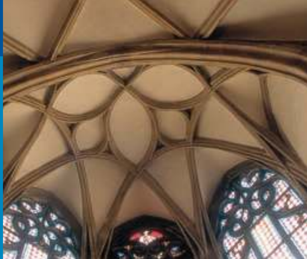
Pozdně gotická kroužená klenba presbytáře v radniční kapli.