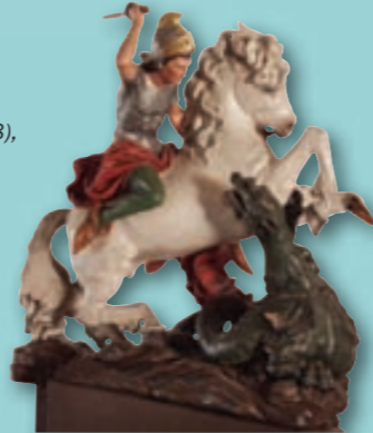
Sv. Jiří s drakem (1898), Bernhard Hoetger.