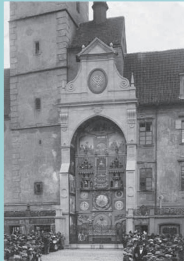
Slavnostní odhalení neogotické podoby orloje 22. května 1898.