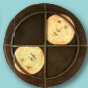
Barokní ukazatel měsíčních fází (1746).