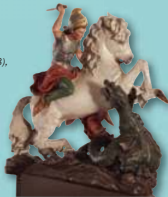
Sv. Jiří s drakem (1898), Bernhard Hoetger.