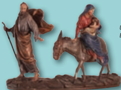
Útěk do Egypta (1898), Bernhard Hoetger.