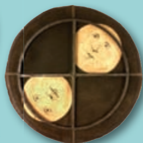
Barokní ukazatel měsíčních fází (1746).