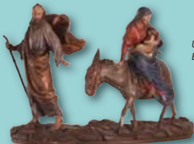
Útěk do Egypta (1898), Bernhard Hoetger.