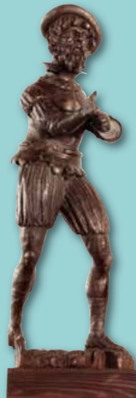
Pohyblivá renesanční plastika zvoníka (1573 – 1575).

větech astronomie. Tehdy došlo k obohacení malířské složky orloje o nástěnné malby s námětem Sedmera svobodných umění na vnitřních plochách výklenku. Dolní část orloje stále zaujímaly Fabriciovy ukazovací terče se čtyřmi menšími ukazateli po stranách. Jejich ciferníky udávaly čtvrt hodiny, celé hodiny, planety a znamení dne a tzv. nerovné hodiny. Den roku označoval na dolním kalendáriu anděl ukazovátkem. Ve střední části orloje se nacházela zvonkohra, nad ní panovnický portrét a v samotném vrcholu plastika pololežící bohyně Luny. Postranní „křídla“ orloje oživovaly skupiny mechanických loutek. Vlevo stál sv. Václav, okolo kterého pronásledoval sv. Jiří na koni ustupujícího draka. Nad nimi mnich probíral při bití hodin v ruce kuličky růžence a poustevník tahal za zvonec. Pravá strana předváděla níže Madonu s Jezulátkem, které adorovali obcházející Tři králové. Nad skupinou vykonával funkci zvoníka renesanční kavalír provázený trubačem. Poslední velká oprava orloje v jeho původní podobě, založené na přesvědčení o pohybu slunce a planet kolem Země, nastala v letech 1746 – 1747. Opět přišli ke slovu hodinář, varhanář a doposud nejvýznamnější známý tvůrce malířské výzdoby orloje, olomoucký barokní malíř Jan Kryštof Handke. Při výběru námětů maleb pro vnitřní stěny