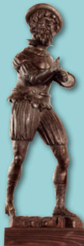
Pohyblivá renesanční plastika zvoníka (1573 – 1575).

věcech astronomie. Tehdy došlo k obohacení malířské složky orloje o nástěnné malby s námětem Sedmera svobodných umění na vnitřních plochách výklenku. Dolní část orloje stále zaujímaly Fabriciovy ukazovací terče se čtyřmi menšími ukazateli po stranách. Jejich ciferníky udávaly čtvrt hodiny, celé hodiny, planety a znamení dne a tzv. nerovné hodiny. Den roku označoval na dolním kalendáři anděl ukazovátkem. Ve střední části orloje se nacházela zvonkohra, nad ní panovnický portrét a v samotném vrcholu plastika pololežící bohyně Luny. Postranní „křídla“ orloje oživovaly skupiny mechanických loutek. Vlevo stál sv. Václav, okolo kterého pronásledoval sv. Jiří na koni ustupujícího draka. Nad nimi mnich probíral při bití hodin v ruce kuličky růžence a poustevník tahal za zvonec. Pravá strana předváděla níže Madonu s Jezulátkem, které adorovali obcházející Tři králové. Nad skupinou vykonával funkci zvoníka renesanční kavalír provázený trubačem. Poslední velká oprava orloje v jeho původní podobě, založené na přesvědčení o pohybu slunce a planet kolem Země, nastala v letech 1746 – 1747. Opět přišli ke slovu hodinář, varhanář a doposud nejvýznamnější známý tvůrce malířské výzdoby orloje, olomoucký barokní malíř Jan Kryštof Handke. Při výběru námětů maleb pro vnitřní stěny