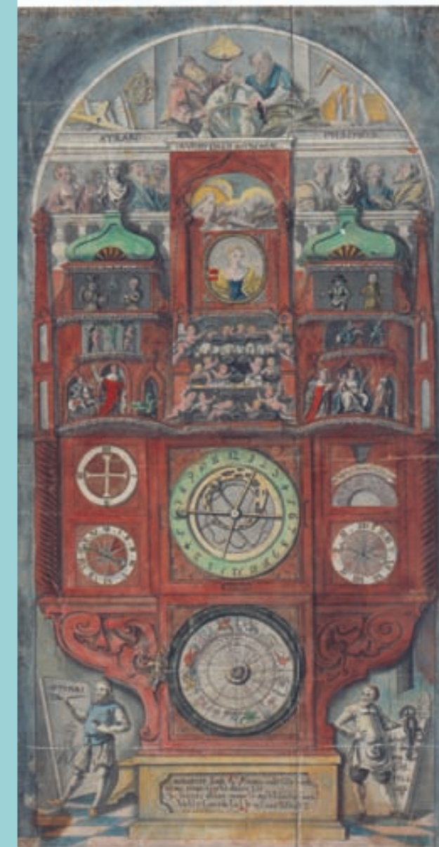
„Vyobrazení uměleckých hodin na olomoucké radnici v jejich znamenitém stavu v roce 1747“. Akvarel J. W. Fischera (1805).

orlojního výklenku se Handke přidržel tématu Sedmi svobodných umění , jejichž výběr podřídil oslavě přírodních věd – Mechaniky, Aritmetiky, Astronomie a Geometrie. K nim se družily Dialektika, Gramatika a Hudba, poslední alegorií do sudého počtu osmi se Handkemu stala nezbytná Příčinnost, podmínka úspěchu v jakémkoli oboru. Na čelní stěně dole Handke sebevědomě vymaloval jako dva hlavní původce celého díla hodináře a malíře, kterého je možno považovat za mistrova vlastní podobizny.