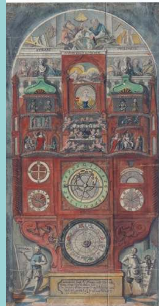
„Vyobrazení uměleckých hodin na olomoucké radnici v jejich znamenitém stavu v roce 1747“. Akvarel J. W. Fischera (1805).

orlojního výklenku se Handke přidržel tématu Sedmi svobodných umění , jejichž výběr podřídil oslavě přírodních věd – Mechaniky, Aritmetiky, Astronomie a Geometrie. K nim se družily Dialektika, Gramatika a Hudba, poslední alegorií do sudého počtu osmi se Handkemu stala nezbytná Příčinnost, podmínka úspěchu v jakémkoli oboru. Na čelní stěně dole Handke sebevědomě vymaloval jako dva hlavní původce celého díla hodináře a malíře, kterého je možno považovat za mistrova vlastní podobizny.