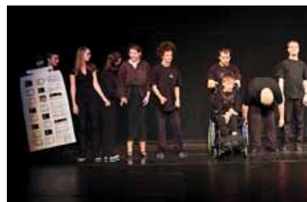
Divadelní FLORA 2012 – vystoupení účastníků kurzu Dramaták SPOLU Olomouc.

Veřejné vystoupení doplní hra Wo(men)'s world aneb Mají se rádi? v podání herců z Divadla MY z olomouckého Klíče a loutkové představení Prodaná nevěsta v režii ZŠ sv. Voršily. Jako host se představí ka-