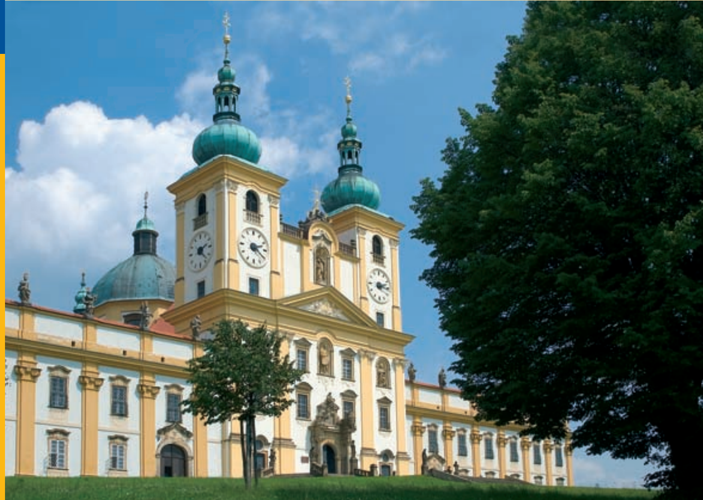
Храм посещения Девы Марии.