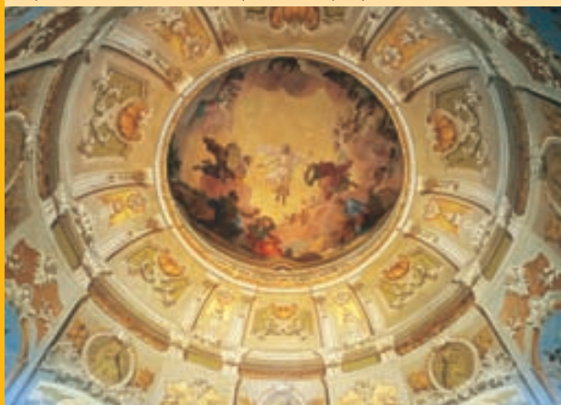
Храм посещения Девы Марии – интерьер.