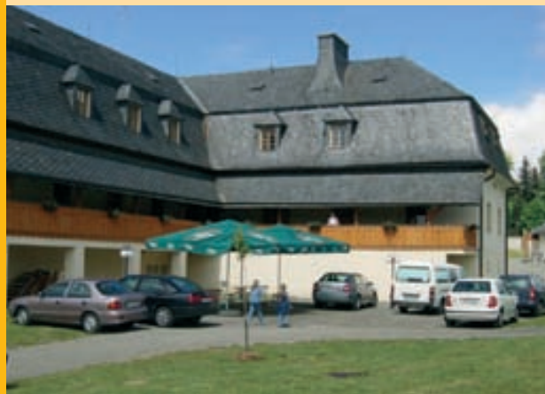
Ресторан - ОТЕЛЬ Fojtstvi.

РЕСТОРАН У МАЦКОВ Ул. Дворского, 32, Оломоуц – Святой Копечек Тел: +420 585 385 344 Пестрый выбор традиционных блюд чешской кухни и различных фирменных блюд. ВТОРН. - СУБ. 10.00 – 22.00, ВОСКР. 9.00 – 22.00