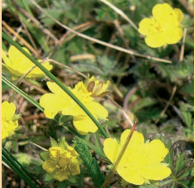
Природный парк Долина Быстрицы.