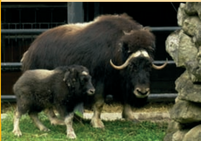
Бык мускусный северный