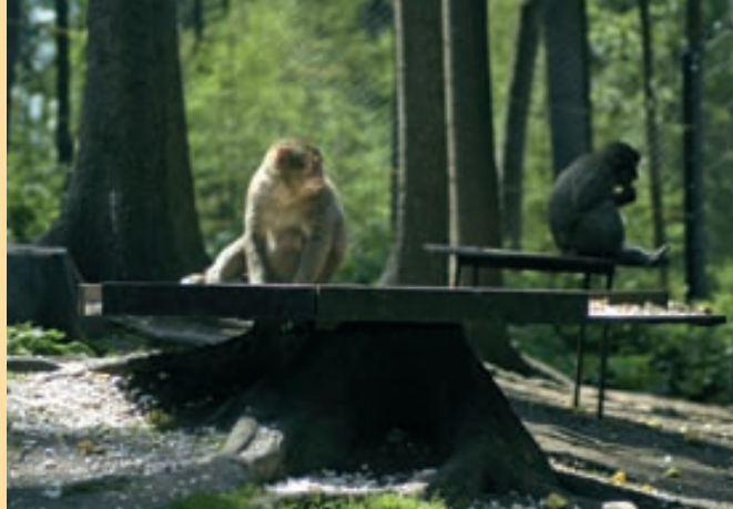
Японская макака в открытом вольере