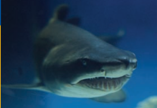
Чернопервая рифовая акула