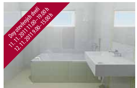
Koupelna ve standardním provedení.

Doporučila byste klientovi spíše koupit nově postaveného rodinného domu de-