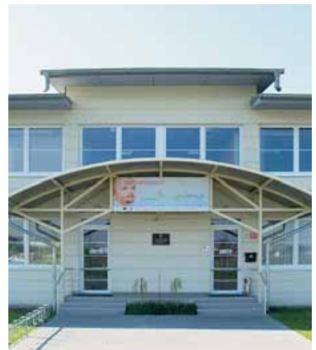
Jedna z budov Vědeckotechnického parku Univerzity Palackého v Holici.