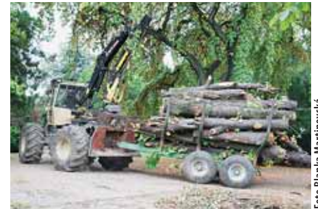
Kácení starých stromů se obešlo bez problémů.