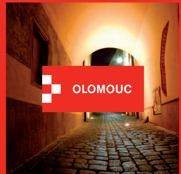
logotyp na neklidném pozadí