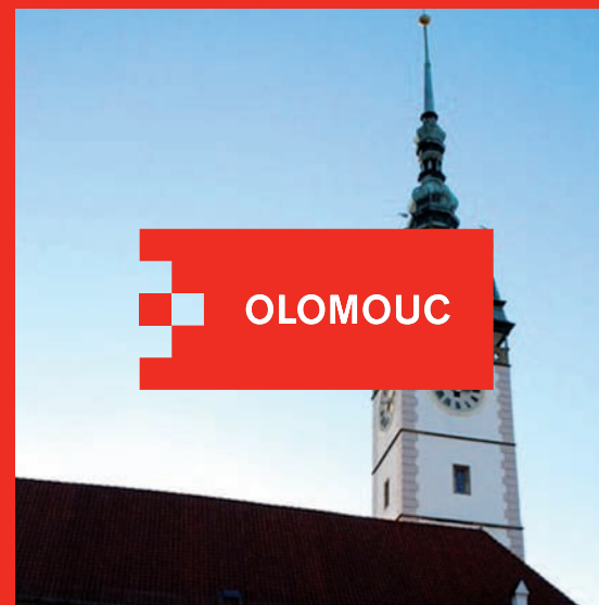
logotyp na klidném pozadí