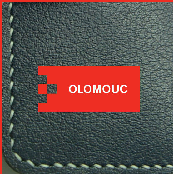
logotyp na jednolitém pozadí